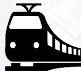
Железнодорожные пути необщего пользования