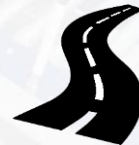
Дорожная инфраструктура (автомобильные дороги)